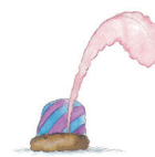
Die wunderschöne Perle

Sonntag, 10. Mai, 17 Uhr, Kirche Regensdorf